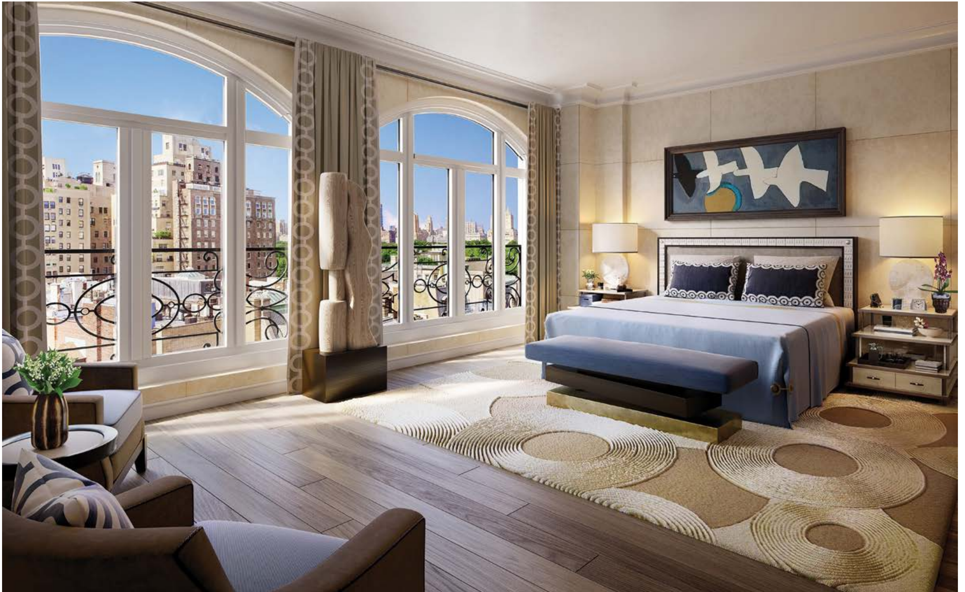
主臥室採用細緻的客製牆壁裝飾線條加以修飾，並採用寬幅白色橡木地板。