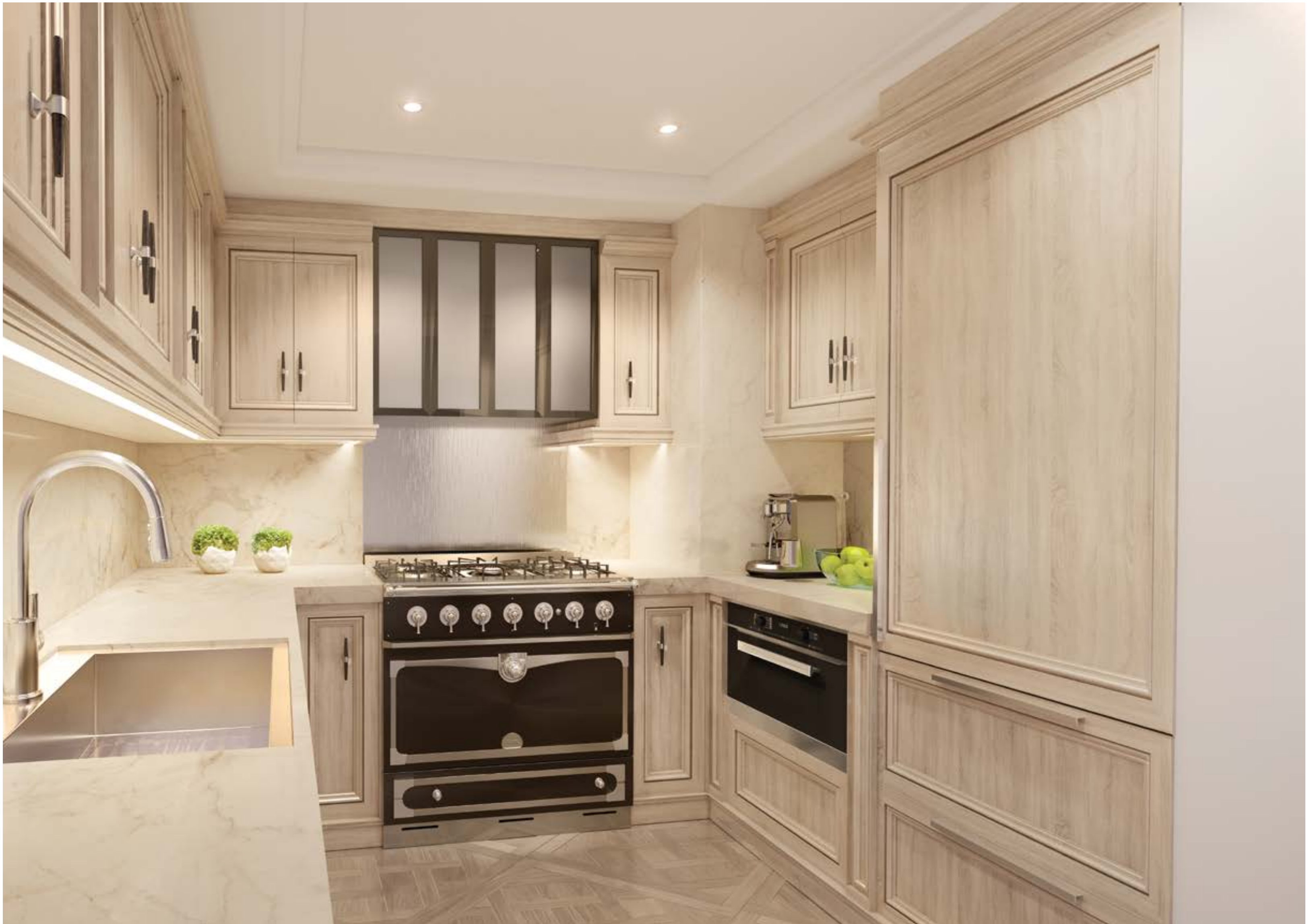
廚房採用法國 La Cornue 頂級廚具產品、Miele 家用電器，搭配 Cabinet Alberto Pinto 自行設計の木製品。