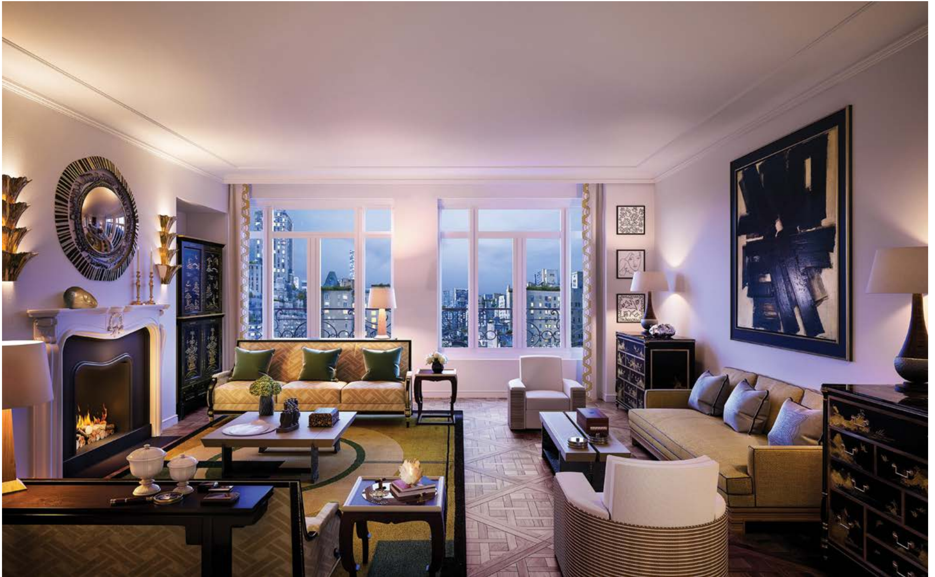
雙拼式住宅設有寬敞的居住空間，精選房屋還配備了 Cabinet Alberto Pinto 自行設計的壁爐。