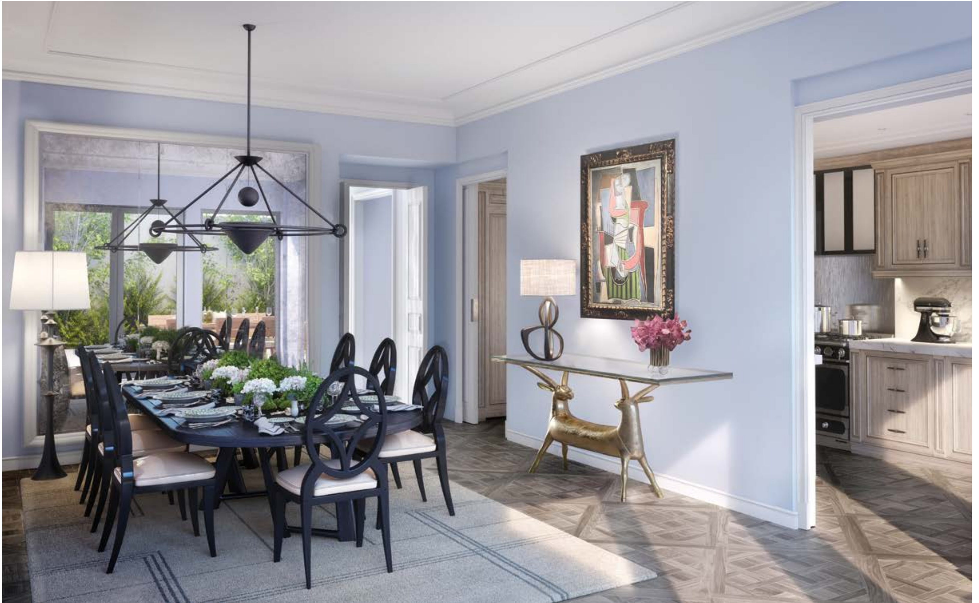
聯排別墅帶有宏偉正式餐廳，面朝私人花園，別具特色。