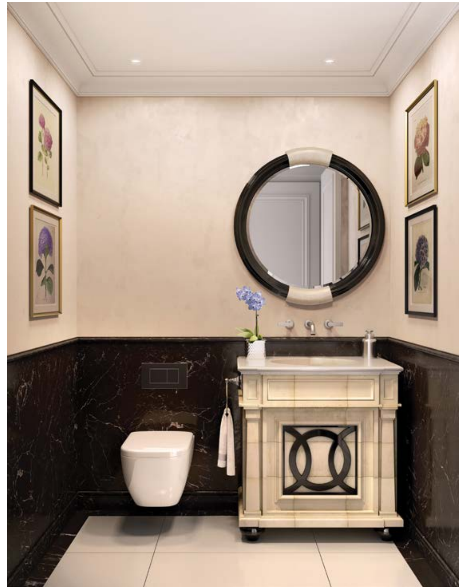
化妝間採用醒目的 Noir Saint Laurent 大理石鑲牆板，搭配白色大理石，與採用精製羊皮紙表面的客製梳粧檯形成了鮮明對比。 .....