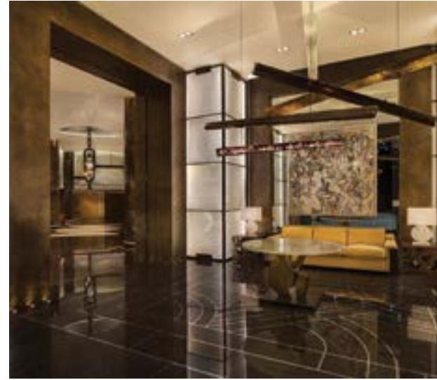
奧登蒙地卡羅大廈