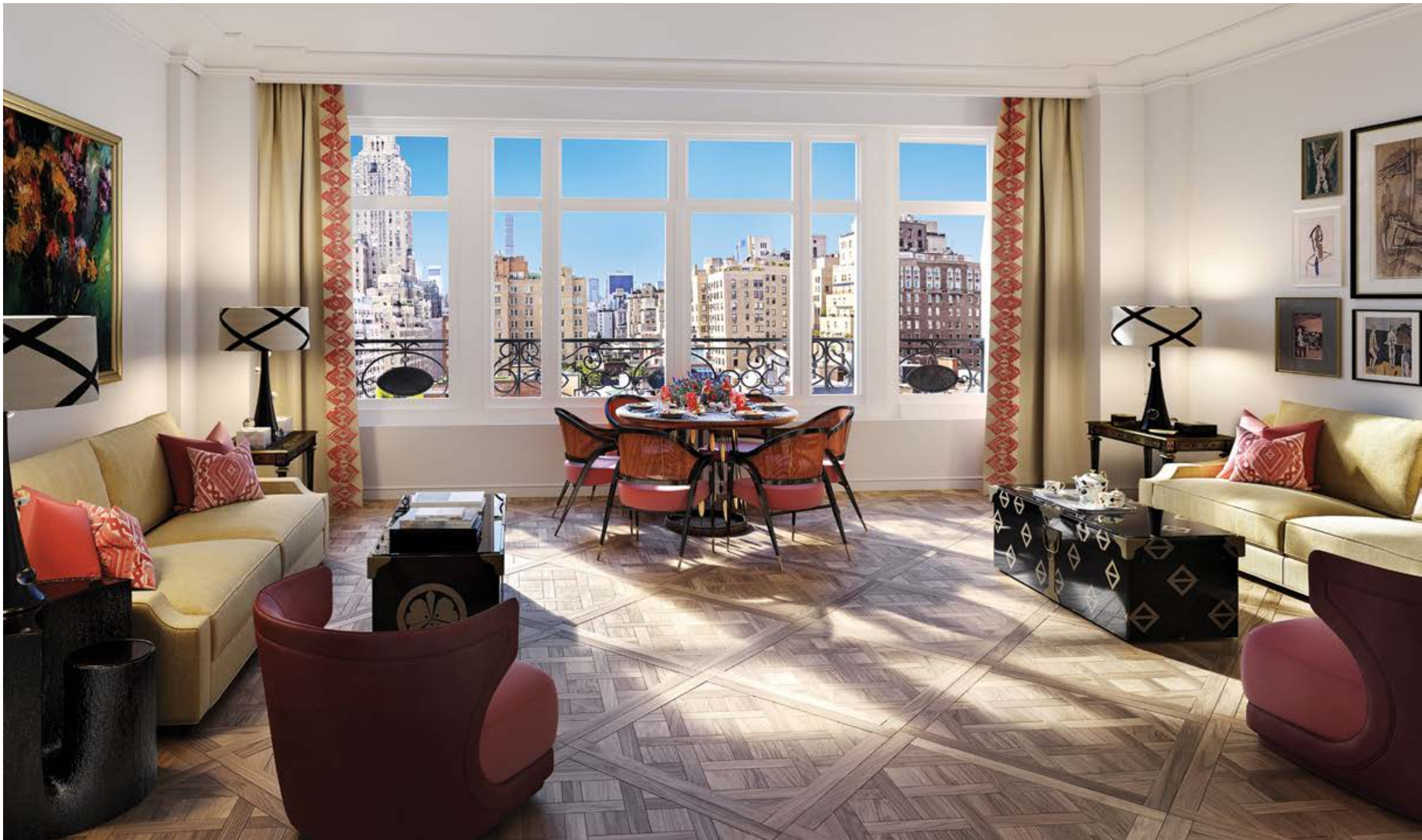
整層住宅視野開闊，可以縱情遠眺歷史悠久、地標林立且風景如畫的 79 街。