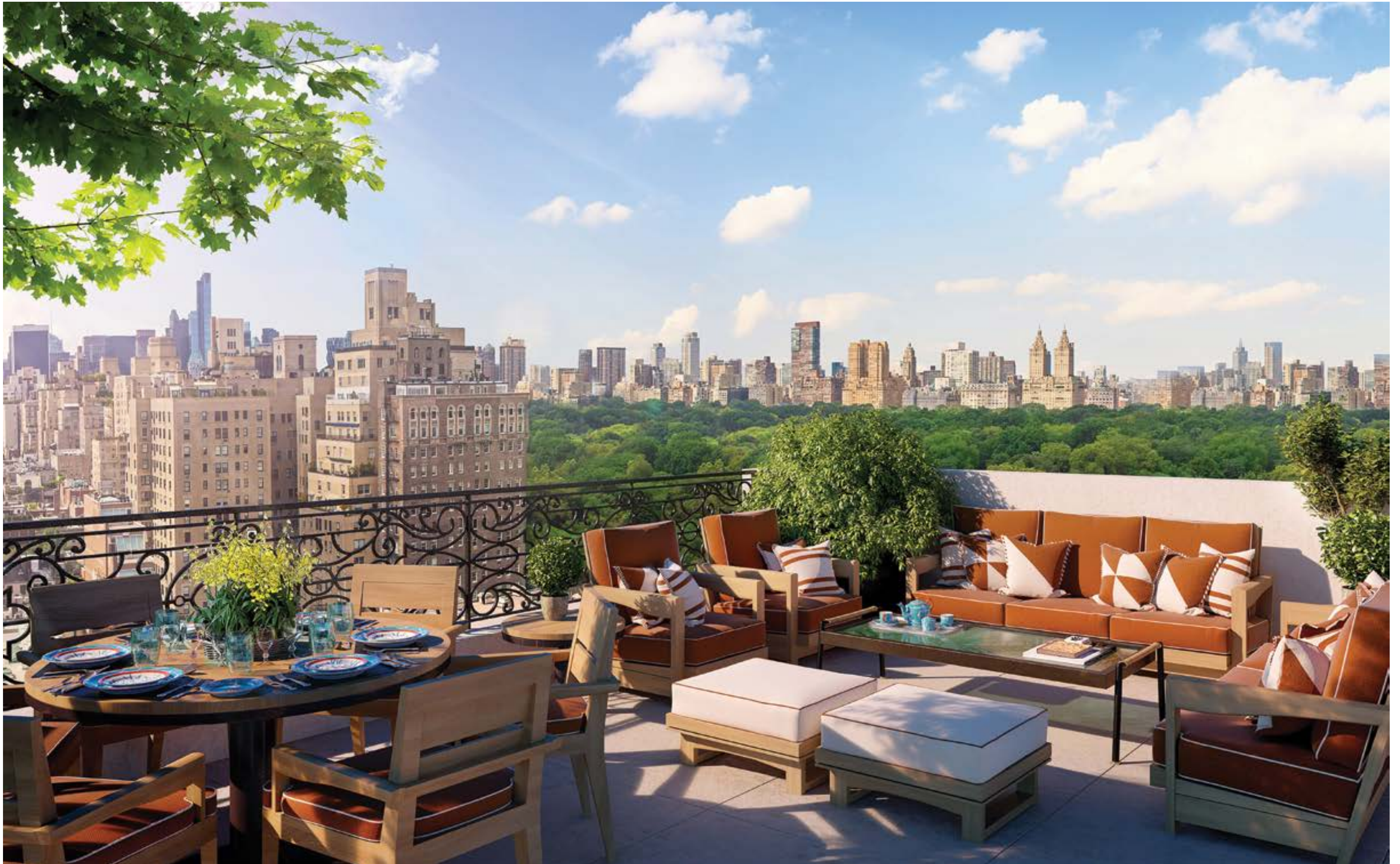
頂層公寓露臺可以俯瞰中央公園美景。