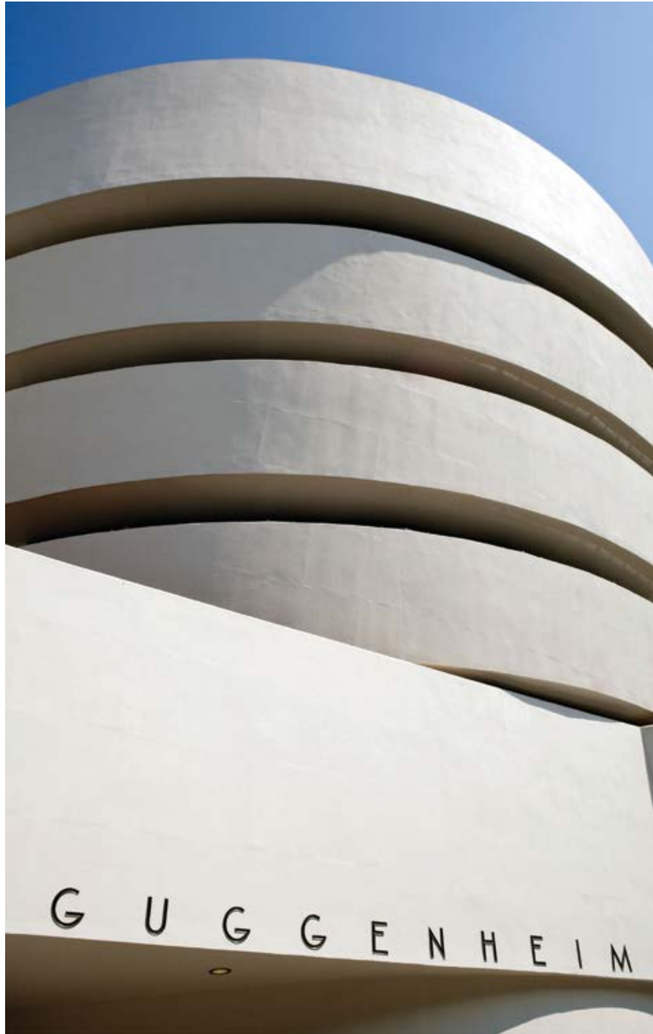
所羅門古根漢博物館