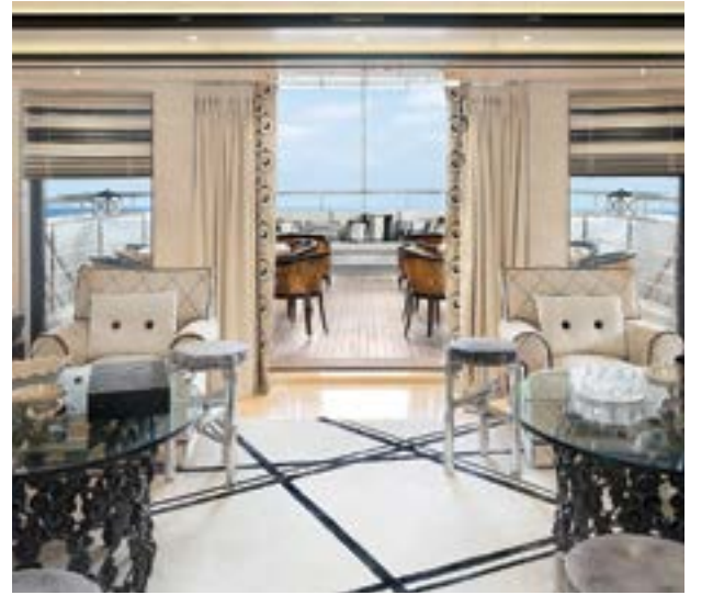
蒂森克虜伯海事系統HDW級240呎遊艇