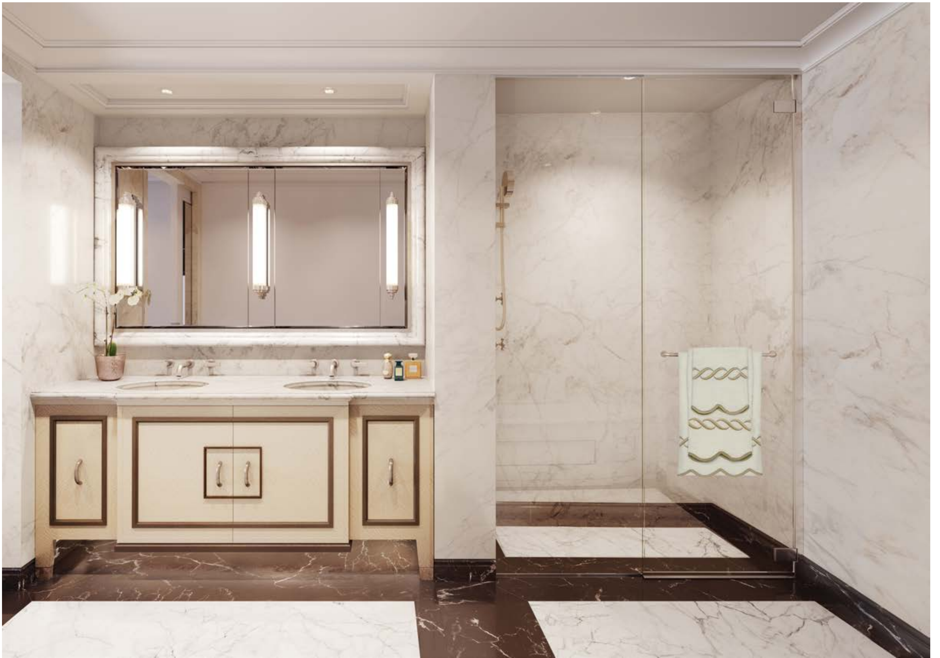
大理石裝飾主臥浴室配備客製實木梳粧檯，搭配拋光鍍鎳的 Kallista 浴室設施。