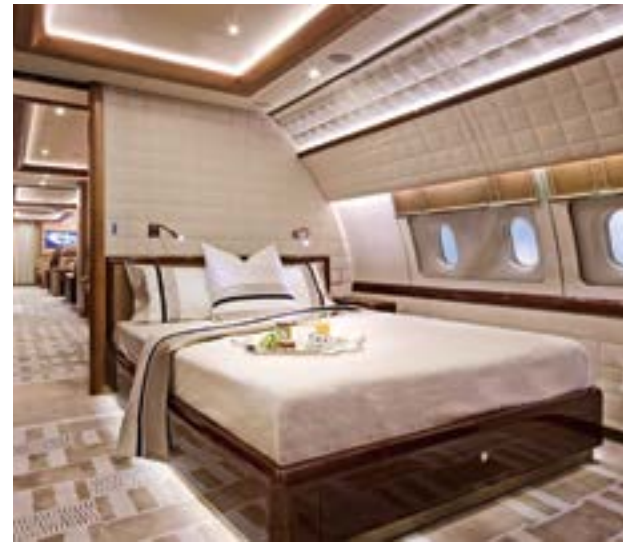
雅典衛城航空A319CJ型空中巴士