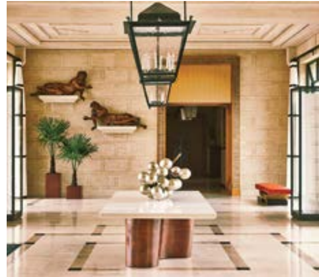
聖埃米利永葡萄酒莊園