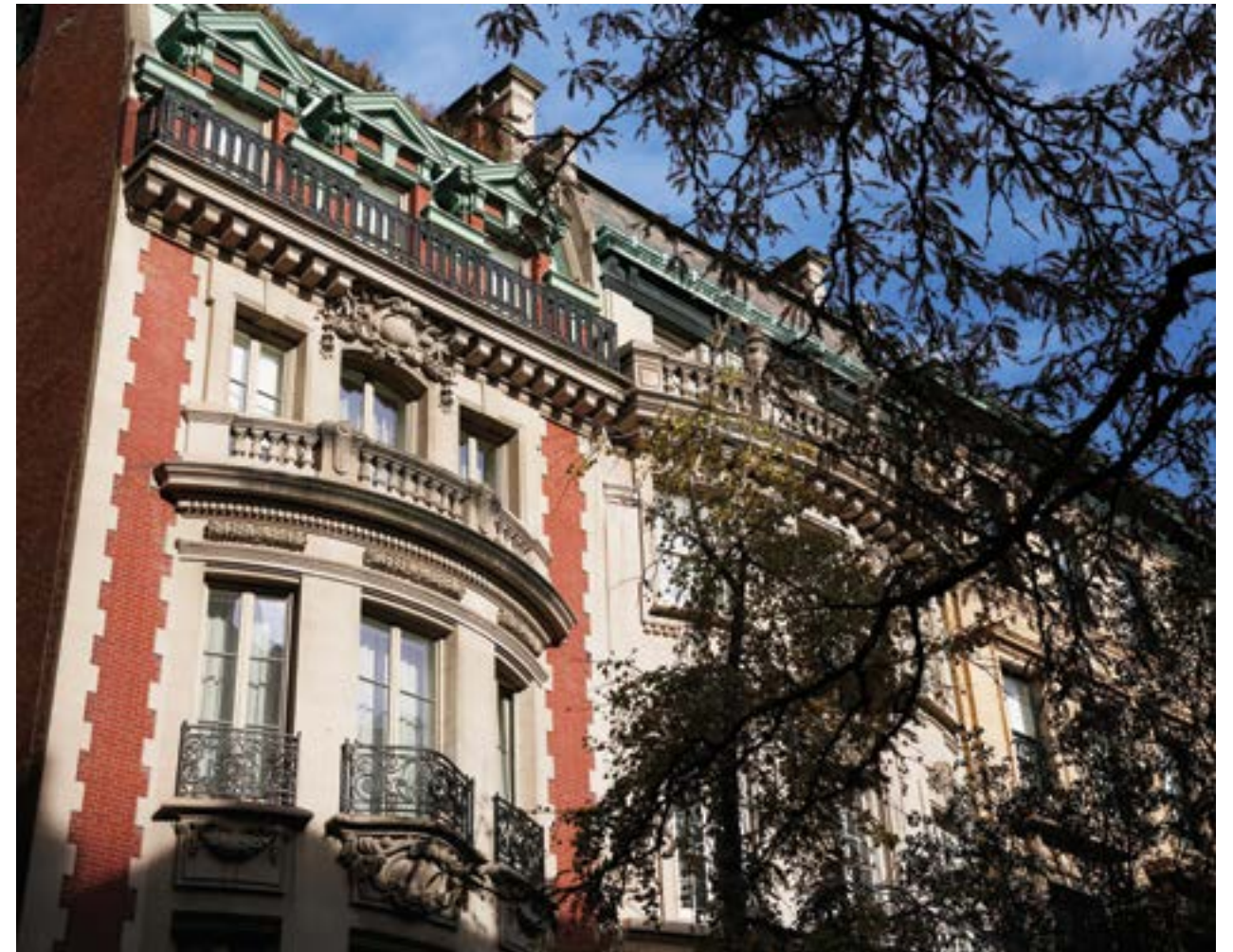
..... 充滿傳奇色彩的建築譜系